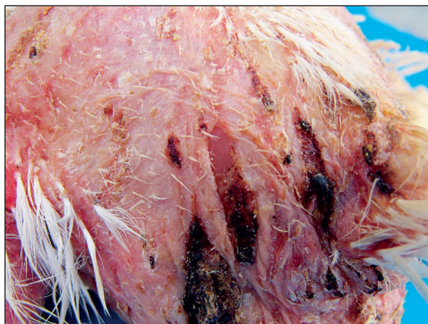
Slika 2. Povrede kože nastale usled prenaseljenosti objekta za živinu

Picture 2. Skin injuries caused by high stocking density of poultry house