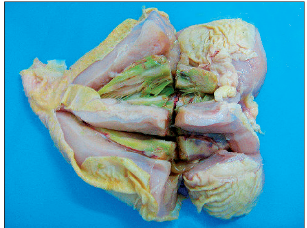
Slika 5. Duboka pektoralna miopatija – bolest zelenog mišića

ske štete ( Lien i dr., 2011; Anonymus, 2008 ). Pojava DPM se povećava sa povećanjem telesnih masa tovnih pilića. Bolest je česta u jatima izloženim stresovima zbog buke, ili uznemiravanja tokom manipulacije radnika u objektu, jer tada ptice naglo pokreću krila. Brzorastuća širokoprсна živina, koja se tovi na ispuštima, često ima promene na dubokom mišiću. Da bi se smanjila pojava promena nastalih na dubokom grudnom mišiću potreban je veliki selekcijski rad kao i pažljivo ophođenje sa živinom. Davanje selena, vitamina E, metionina ili drugih elemenata i jedinjenja nije dalo rezultate u smanjivanju ovog problema.