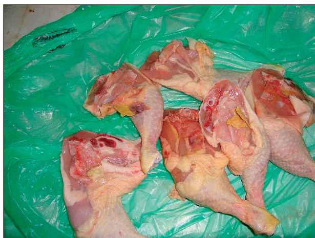
Slika 3. Celulitis – kazeozne nakupine između mišića

Tovni pilići, uglavnom, se uzgajaju na podu u dubokoj prostirci. Podovi objekata su tvrdi, obično betonski, a kao prostirka služe, uglavnom, sporedni proizvodi poljoprivredne proizvodnje. Greške u odabiru prostirke mogu biti uzrok različitih poremećaja, kako na nogama, tako i na ostalim delovima tela. Jedan od tih poremećaja je kontaktni dermatitis (Contact Dermatitis, Hock Burn, Pododermatitis) koji se susreće kod svih kategorija živine, ali najčešće kod roditelja teških linija i brojlerskih pilića, posebno u uslovima povećane gustine naseljenosti (Blokhuys i van der Haar, 1990). Usled dugotrajnog stajanja na nekvalitetnoj, vlažnoj i tvrdj prostirci, nastaju promene na stopalima (mekanim delovima) koje se šire na zadnje površine skočnog zgloba (slika 4). Intenzitet promena je različit, od promena na površini kože do dubokih ulceracija, što je u direktnom odnosu sa higijenskim uslovima u objektu. Te promene omogućavaju ulazak bakterija, koje izazivaju sekundarne infekcije. Na klanicama se zbog toga odbacuju noge i drugi promenjeni delovi trupa.